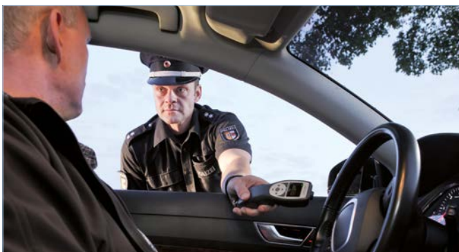
Scan-Modus: Detektion von Alkohol in Innenräumen