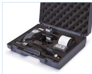
Großer Koffer (konfigurierbar)